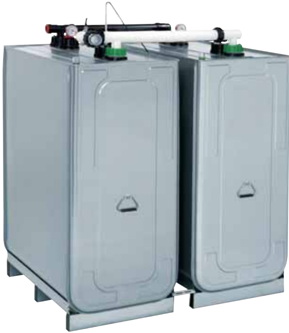
Doppelwandtanks DWT mit 750, 1000 und 1500 Litern Inhalt – feuerfest, lichtundurchlässig, diffusionsdicht, hochwassersicher