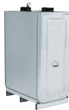
Vitoset Doppelwandtank DWT