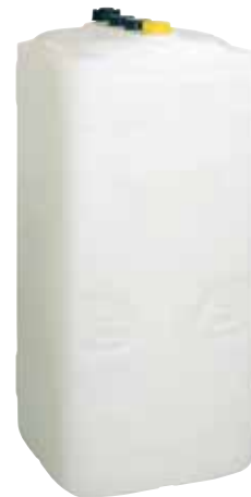
Vitaset Kunststoffwannen-Tank KWT