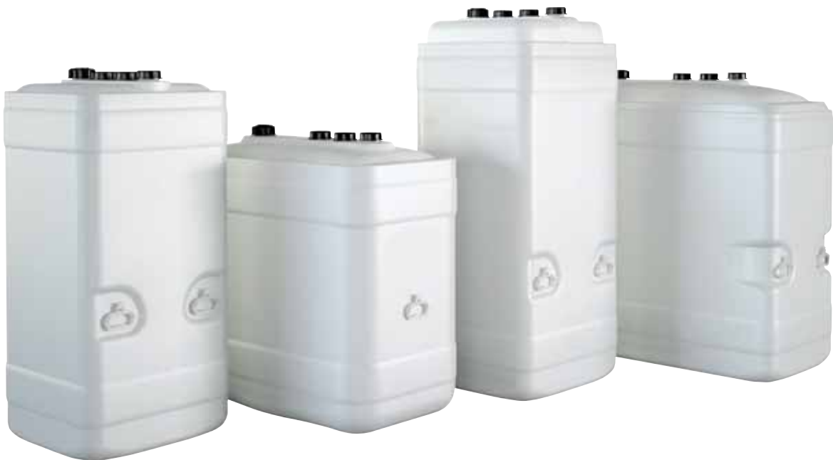
Kunststoffwannen-Tanks KWT (750 I-C, 1000 I-R, 1000 I-C, 1500 I-R) – kompakte Abmessungen, geringes Gewicht