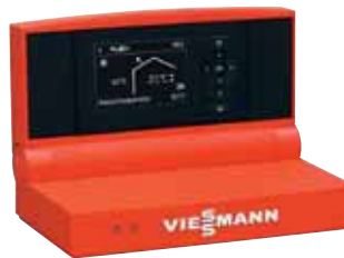
Vitotronic 200 Regelung mit übersichtlicher Menüführung